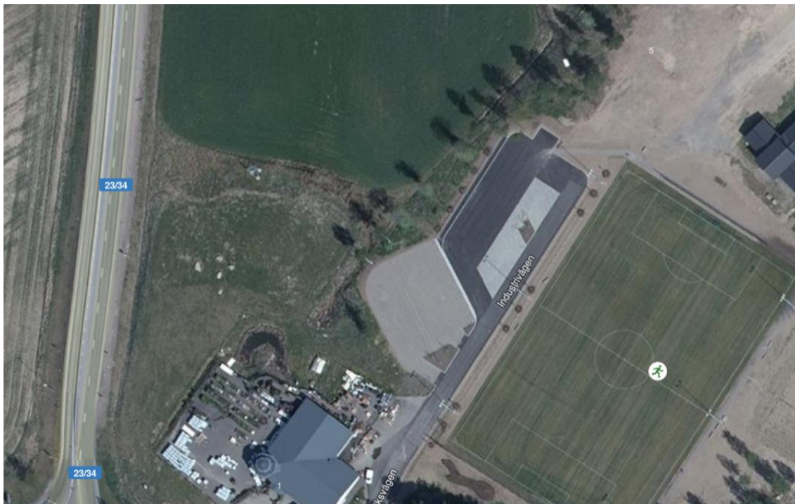
Figur 2: Parkeringsplatser.

Andra förutsättningar som gäller för arbetet är att försöka bevara de befintliga parkeringsplatserna i området, då dessa är nyanlagda i området till Hackelhallen. Se figur 2.