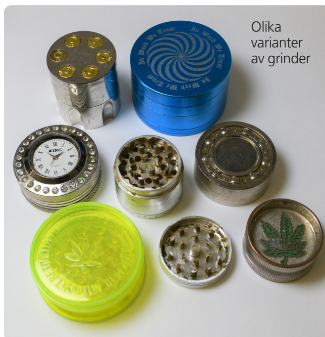
Olika varianter av grinders

I cigarettpaket kan färdigrollade eller halvrukta joints gömmas. Joint är en cigarett som innehåller cannabis.