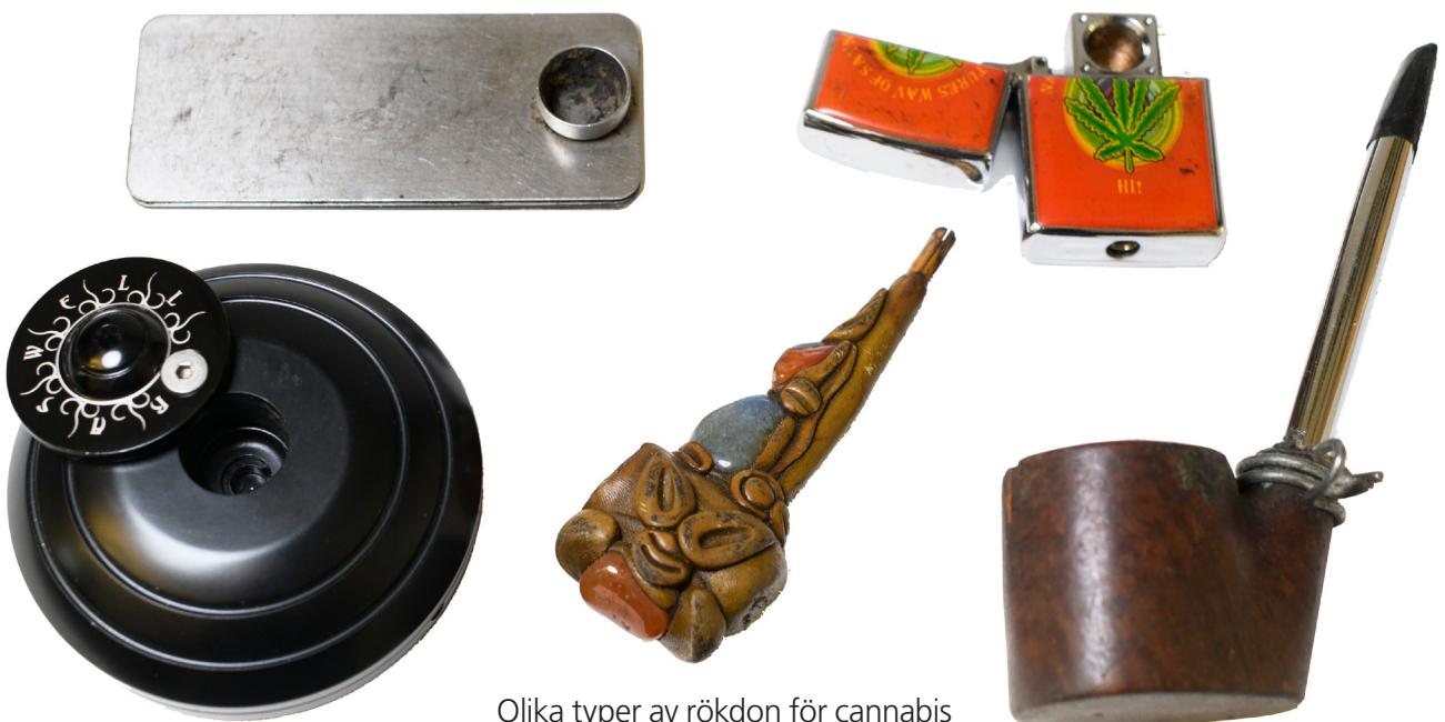
Olika typer av rökdon för cannabis