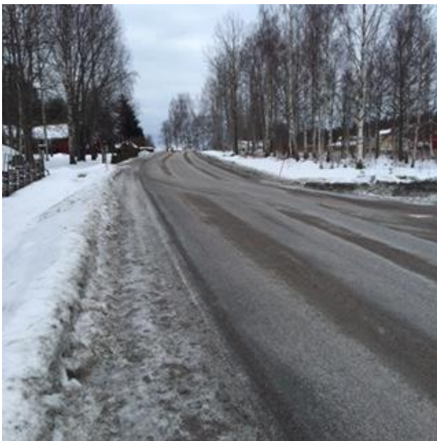
Figur 5: Sikt österut Västra vägen.