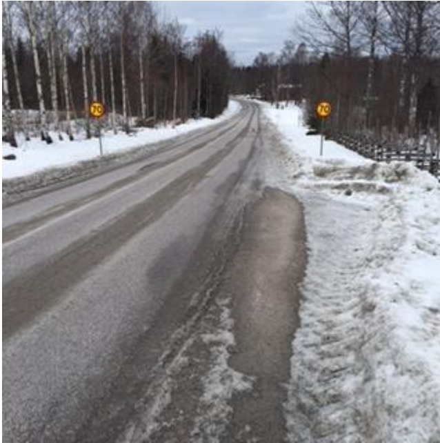
Figur 4: Sikt västerut Västra vägen.

I läget för anslutning i höjd med Västra vägen är det fri sikt ca 200 meter västerut enligt figur 4 och ca 95 meter österut enligt figur 5.