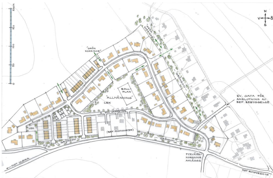
Figur 2: Alternativ 1 - en anslutning till nya bostadsområdet.