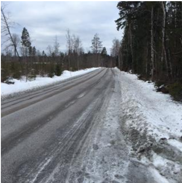
Figur 6: Sikt västerut.

I läget för en anslutning till området även i höjd med den västra delen av exploateringen är det fri sikt ca 150 meter västerut enligt figur 6 och ca 180 meter österut enligt figur 7.