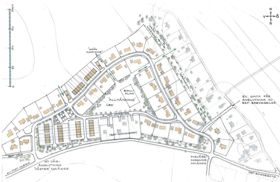
Figur 3: Alternativ 2 - två anslutningar till nya bostadsområdet.