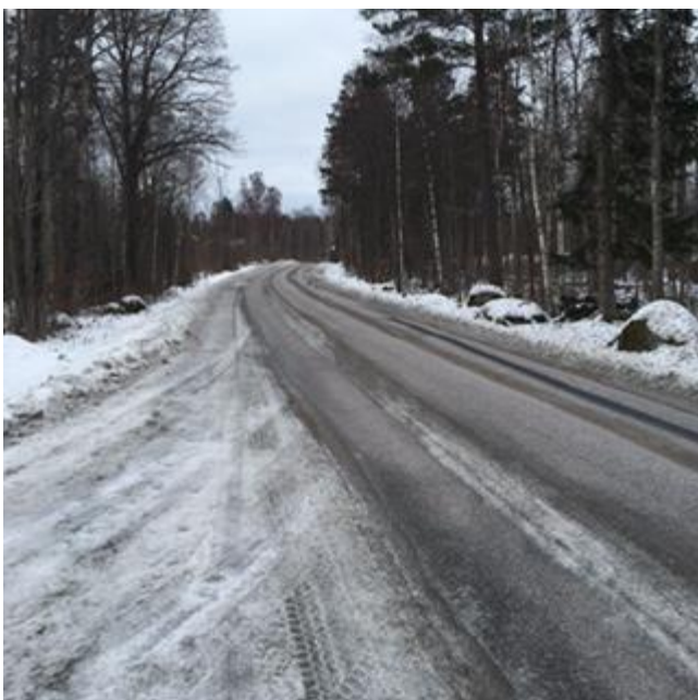
Figur 7: Sikt österut.