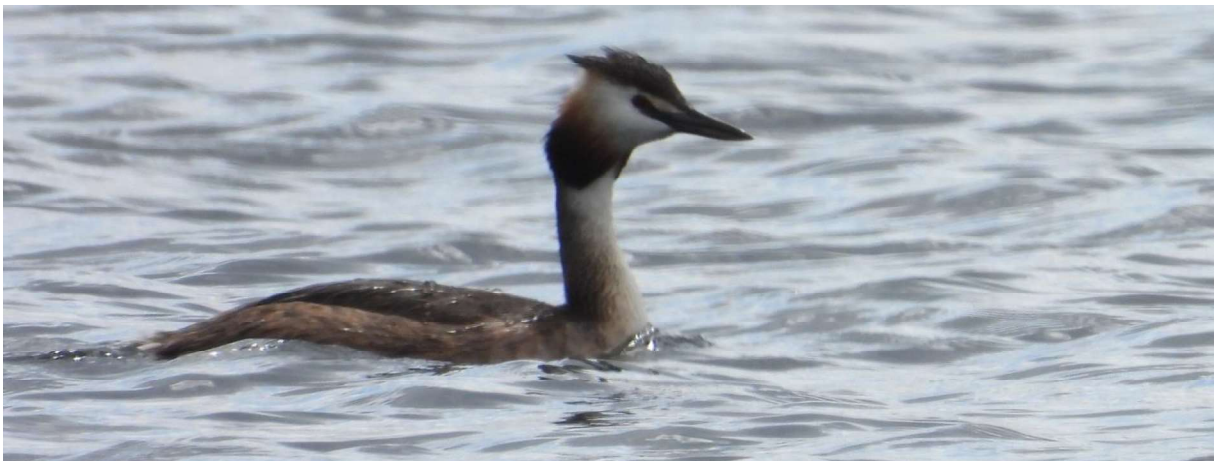
Skäggdopping, en karaktärsfågel för de mer näringsrika sjöarna i kommunen. Den finns också ofta i en del stilla vikar i våra större mer näringsfattiga sjöar.

Grunden för vårt strategi- och åtgärdsprogram är de åtgärdsbehov som upptäckts under naturinventeringar och andra uppdateringar av kommunens tidigare naturvårdsprogram men också via dialog med naturvetare och andra berörda aktörer. Eftersom kommunens äger såväl tätortsnära marker som skog och betesmarker utanför tätorterna är det viktigt för oss att inte bara visa goda exempel inom naturvårdsarbetet med kommunala marker utan också behålla befintliga och skapa nya kontakter med markägare och hitta framtida samverkansformer för att bevara den biologiska mångfalden och förbättra friluftsliv och rekreation.