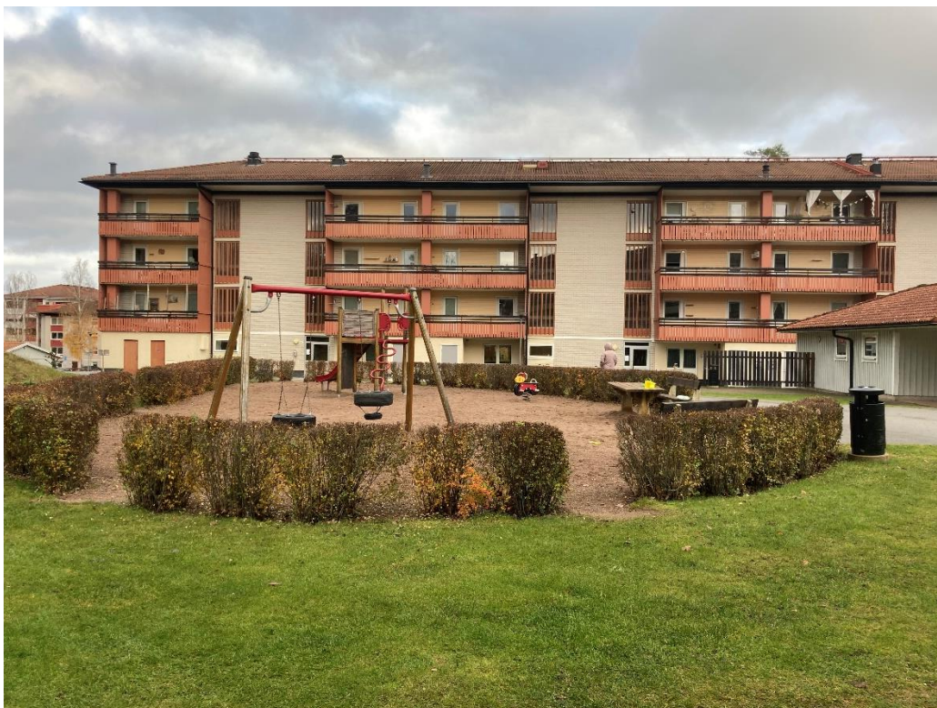
Foto taget på flerfamiljshus på Bergdala/Singelberget

I planprogrammet presenteras olika alternativ till förslag hur hela området kan gestaltas och utformas för att skapa en god boendemiljö för barn och unga som redan bor i området idag och som i framtiden kan komma att flytta till antingen en lägenhet i flerfamiljshus eller radhus inom området. Två förslag på placering av en förskola presenteras i planprogrammet. Förslagen har tagit hänsyn till möjligheterna att skapa en bra miljö och i samband med detaljplaneläggning och projektering behöver en god trafiklösning utformas som är säker för barn och unga.