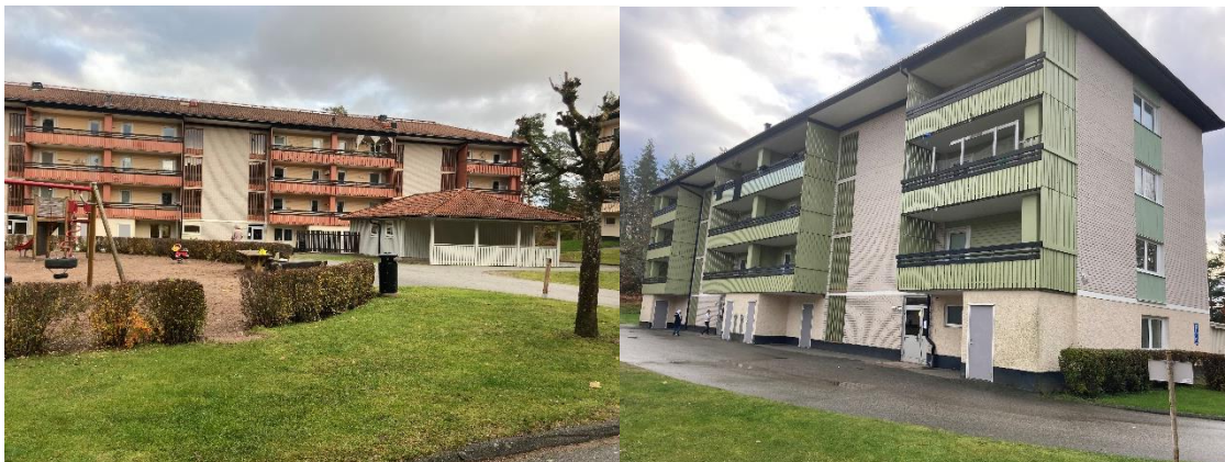
Foto tagna på flerfamiljshus på Bergdala/ Singelberget

Området vid Gamla Folkets Park var förr i tiden en plats för nöje. Idag är alla byggnader i området rivna och kvar finns en plan växtbeklädd yta omgiven av en skogsmiljö med stenhällar.