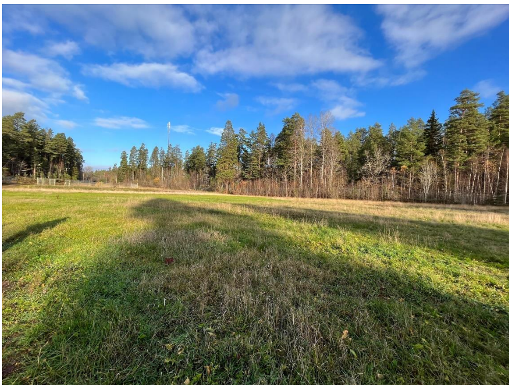
Foto taget vid Gamla Folkets Parkområdet

Inom planprogramsområdet finns större sammanhängande grön- och naturområden och flera av dem kommer fortsatt att finnas kvar om intentionerna i planprogrammet följs i efterkommande detaljplaneläggning.