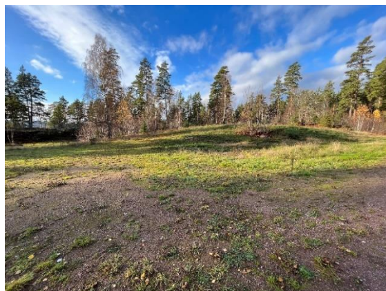
Foto tagna vid Gamla Folkets Parkområdet

I de förslag som presenteras i planprogrammet finns en blandning av flerfamiljshus i olika våningsantal tillsammans med radhus. På Singelberget/ Bergdala föreslås en yta för en framtida förskola alternativt någon form av vårdboende. Om inget av detta skulle byggas kan någon form av boende i en våning byggas. Det viktiga är att ta tillvara stenkullen och grönområdet som finns invid den föreslagna platsen. I planprogrammet föreslås en blandning av hyres- och bostadsrätter för att människor från olika socioekonomiska grupper och åldrar ska blandas. Med en blandning av människor från olika socioekonomiska grupper och åldrar skapas goda förutsättningar att få ett område där människor med olika förutsättningar kan mötas och med en blandning av åldrar kan olika generationer bo tillsammans.