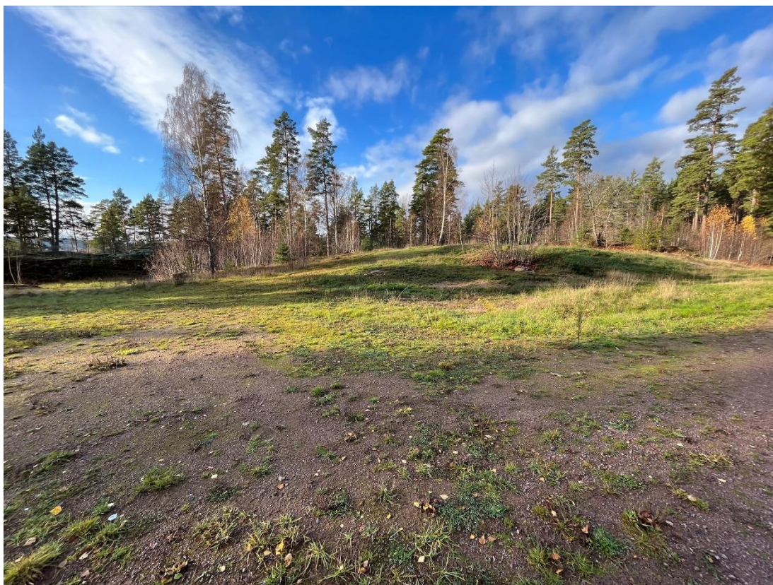
Foto taget vid Gamla Folkets Parkområdet

Planprogrammet innebär störst förändring för Gamla Folkets Parkområdet som idag består av olika typer av grön- och naturområden. Inom området föreslås i samtliga tre förslagen en större utbyggnad av bostäder som omges av naturområden.