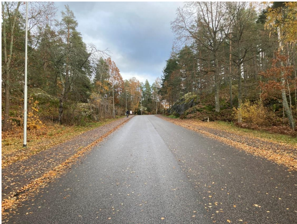
Foto taget på Bergdalagatan upp mot Bergdala/ Singelberget

I övrigt finns det en gångväg ner till idrottsplatsen som ligger strax öster om planprogramsområdet. Den vägen är säker och det enda man behöver se till är att den har en god belysning. Detsamma gäller den mindre gångvägen som löper ner mot Bergdalagatan från den norra delen av Bergdala/ Singelberget.