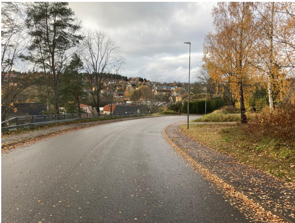
Foto taget på Bergdalagatan

På Bergdala/ Singelberget finns flera utmaningar som belyses i planprogrammet. Området är idag segregerat och det bor många som tillhör en socioekonomiskt utsatt grupp. Det finns också många äldre i området.