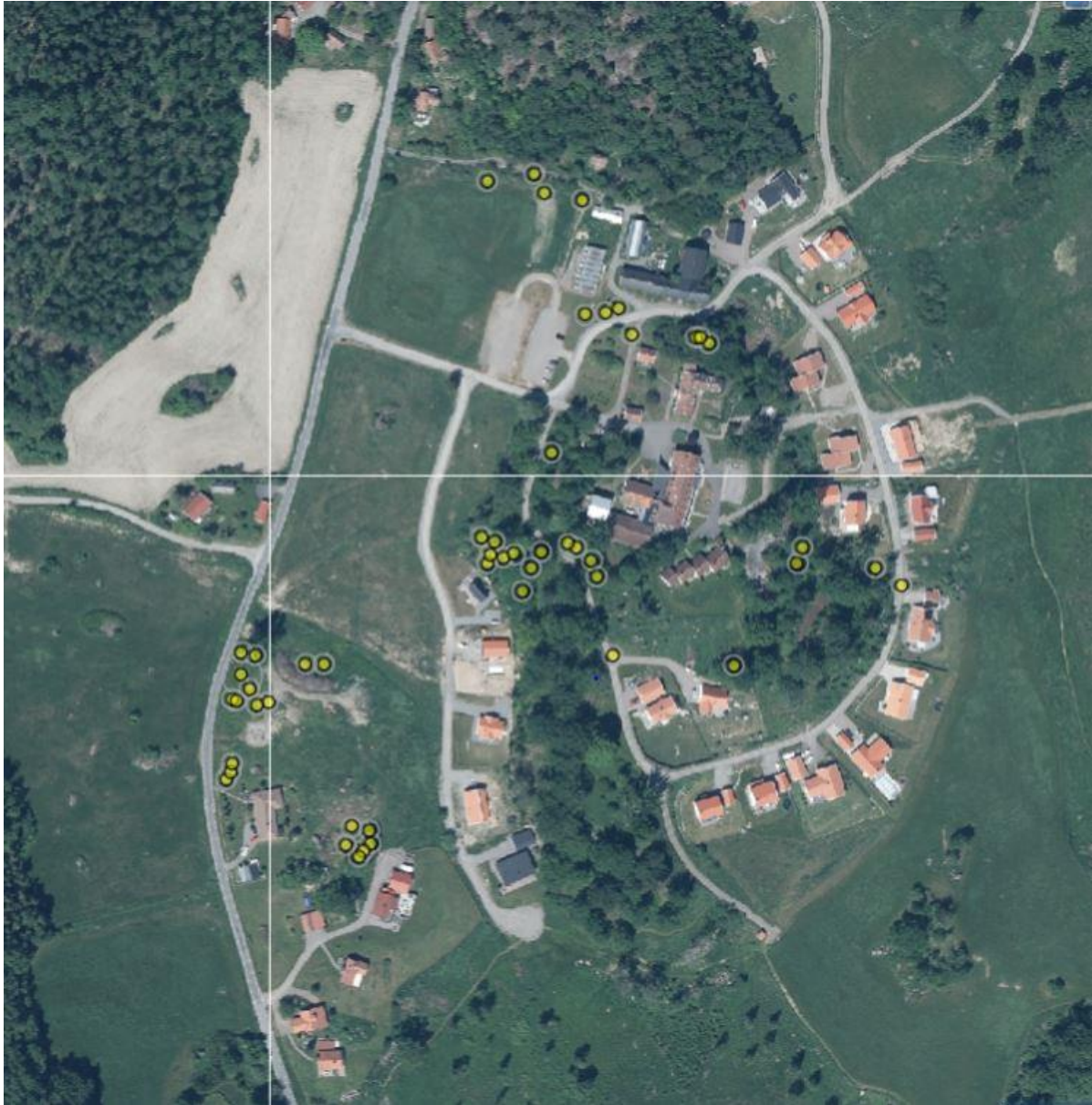
Karta 3. Gullvivor växer spritt inom området kring konferensanläggningen, och många berörs inte av de planerade byggnationerna.

Slutsats för gullviva: Gullviva har gott om växtplatser inom det tilltänkta detaljplaneområdet. Det är främst växtplatserna i sydväst som berörs av de planerade nya tomterna. Gullviva är spridd inom Kinda kommun men gott om växtplatser. Den aktuella planen torde inte på något vis påverka artens bevarandestatus, som bedöms som god.